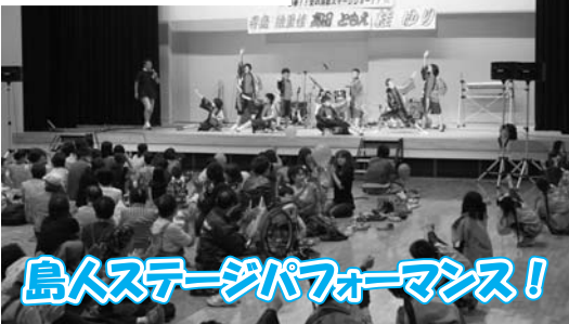
島人ステージパフォーマンス!