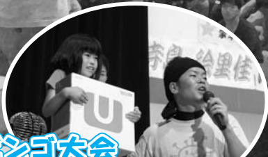
ビンゴ大会 1位には人気ゲーム機セット!