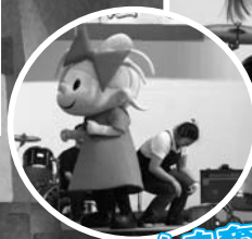
リボンちゃんも奮闘!