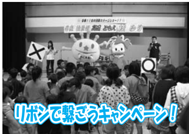
リボンで繋ごうキャンペーン!