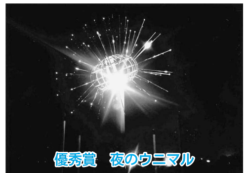
優秀賞 夜のユニマル