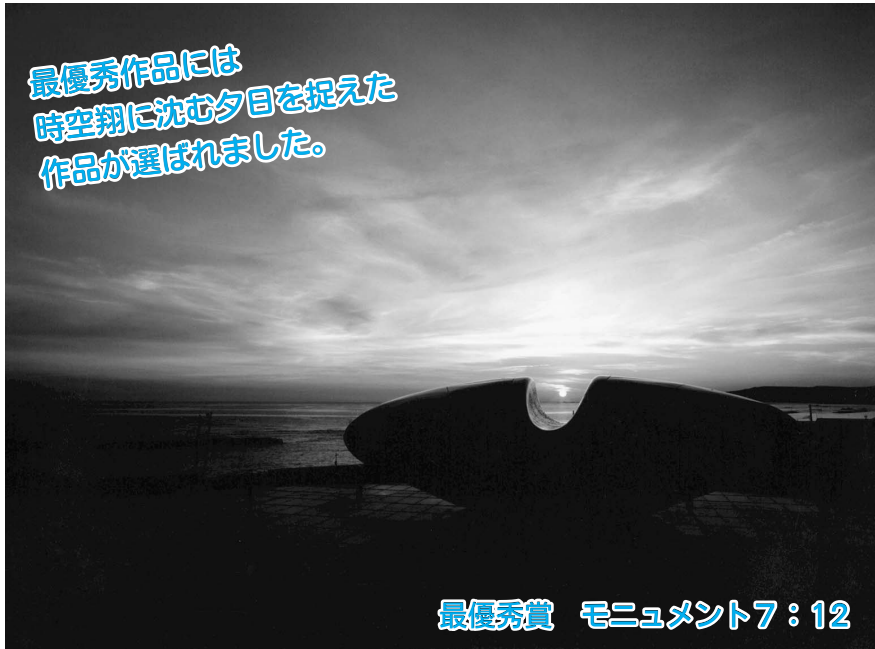
最優秀賞 モニュメント7:12

奥尻島観光協会では、島の魅力をPRし観光を盛り上げるため、今年で3回目となる『奥尻島観光フォトコンテスト』の審査会を1月22日(火)に開催しました。今年のテーマは「島の自然や人・日常風景などが表現され奥尻にいつてみたくなるような魅力ある写真」と題し、全部で61作品の応募がありました。 また、審査には新村町長や制野会長のほか各団体の代表者が審査にあたり、数ある素晴らしい作品の中から厳選し、次の入賞作品を決定しました。 (作品は5月より、フェリーターミナルで展示します)