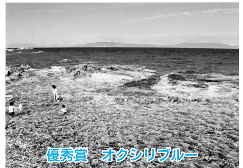
優秀賞 オクシリブルー