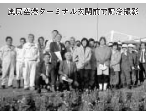
奥尻空港ターミナル玄関前で記念撮影