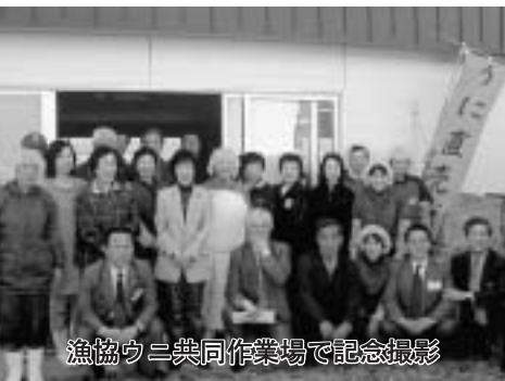
漁協ウニ共同作業場で記念撮影

初めての体験に知事は「結構難しいものです」と苦戦しながらも、「初めてにしてはお上手です」と周りから褒