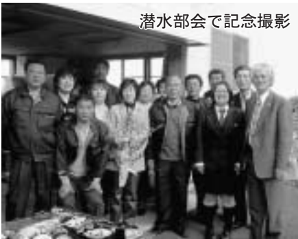
潜水部会で記念撮影

突然の出来事に知事は感激し、スケジュールの合間をぬって会員と談笑したり、奥尻島の海の幸を味わっていました。