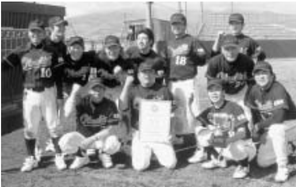
優勝した奥尻町役場野球部のメンバー