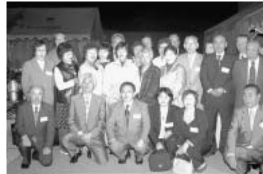
▼あわび種育苗センター前で記念撮影

この日の最後の予定として知事は、神威協地区のあわび種育苗センター前で、町内各団体の代表者らとの夕食会