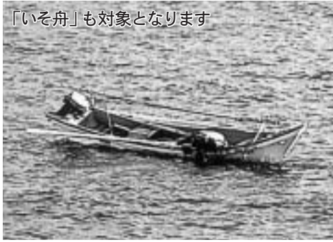
「いそ舟」も対象となります

これに違反した場合は6ヵ月以内の免許停止等の処分の対象となり、再教育講習を受講することになります。不慮の事故に備え、航行中や漁労中に限らず、日頃からライフジャケットの着用を心がけてください。