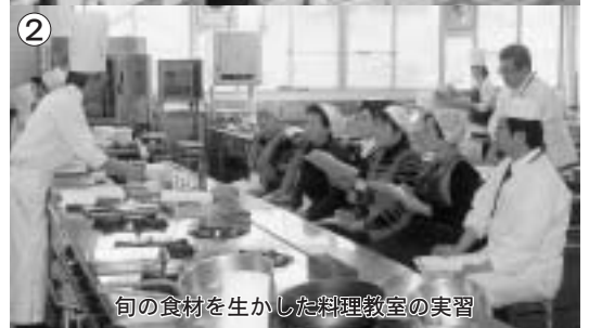
② 旬の食材を生かした料理教室の実習