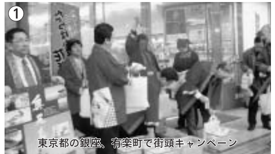
① 東京都の銀座、有楽町で街頭キャンペーン

明るく思いやりのある子供に育ててほしい♡ （本人の夢）大きくなったら看護師になりたい