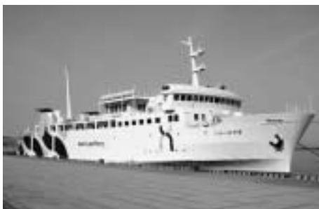
船体のデザインが変更になったニューひやまとアヴローラ奥尻（写真はニューひやま）