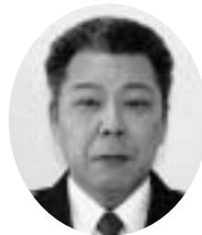
北海道函館方面江差警察署 奥尻駐在所長（警部補）

平成20年4月1日付けの北海道警察の定期異動で、新たに着任しました奥尻・青苗駐在所長をご紹介します。