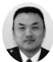
北海道函館方面江差警察署 青苗駐在所長（巡査部長）