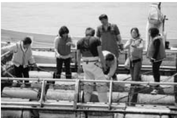
【写真】 鮑を海上で食べる。都会ではできない貴重な体験