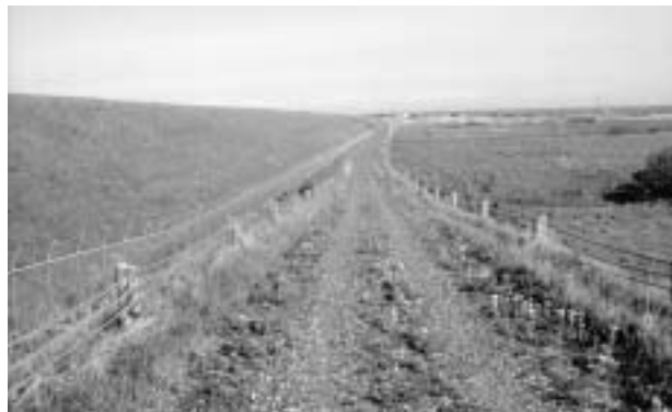
【写真】 小道を生かした観光地づくりで町民も楽しめます。 〔場所米岡地区〕