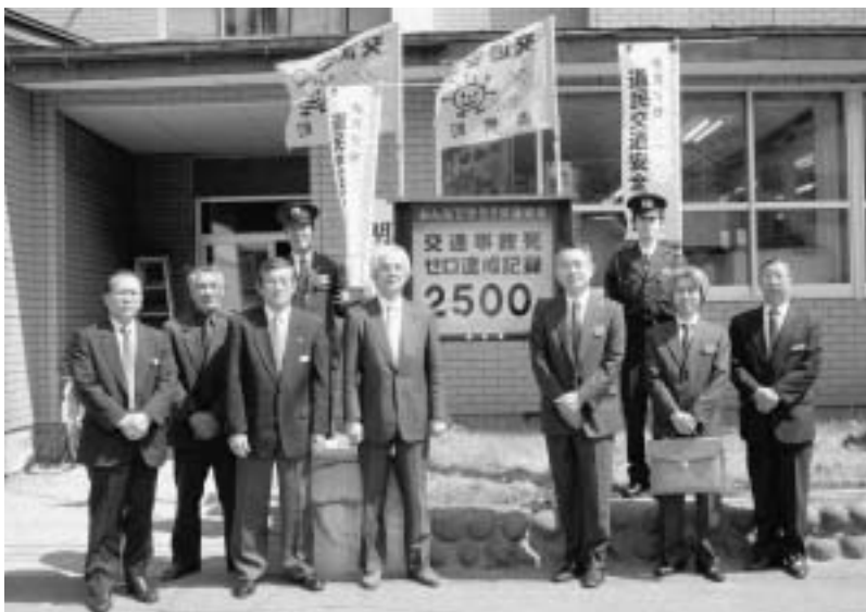
▲交通事故死ゼロ達成記録表示板の前での記念撮影