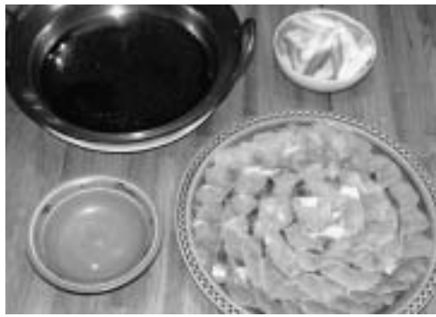
【写真】旬の食メニュー開発事業 料理研究会写真・ほっけのはんじゅく

町民試食会等を積極的に展開した「奥尻島四季・旬のメニュー開発事業」において学んだ島食材を用い西洋風にした「奥尻ブイヤベース」をメニュー化して、飲食店・宿泊施設関係者を中心に7月以降のシーズンデビューを目指します。