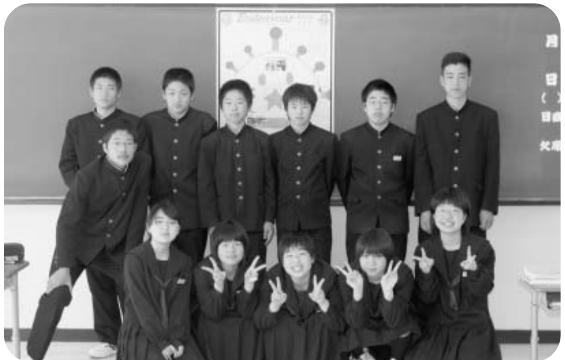
▲記事（日本語と英語）を書いた奥尻中学校3年生