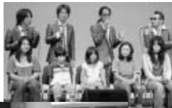
コンサート後の 握手会とサイン会

クワイバーハイパーモニターは、神戸を中心に全国各地で公演を行っており、2年前にも奥尻町でコンサートを行っています。今年4月にメジャーデビューを果たし、5月からコンサートツアーを行っており、奥尻町で再びその歌声を披露することとなりました。