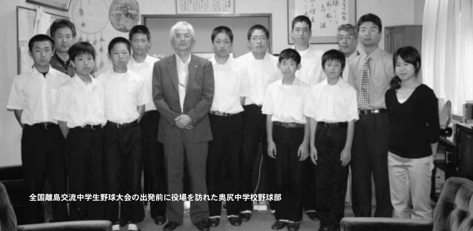
全国離島交流中学生野球大会の出発前に役場を訪れた奥尻中学校野球部