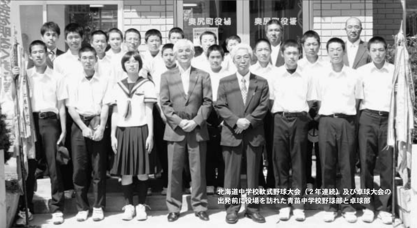
北海道中学校軟式野球大会（2年連続）及び卓球大会の出発前に役場を訪れた青苗中学校野球部と卓球部