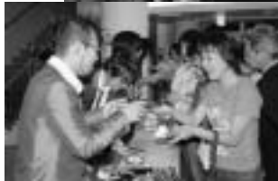
▲来場者へ「ハイパー アーティスト」の プレゼント

会場には約300人が来場し、オリジナルの曲を中心に十数曲を披露し、最後は震災から15周年を迎えたというところで、神戸の小学校の先生が阪神大震災からの復興を祈り作られた曲「しあわせ運べるように」を奥尻町の皆さんにもおぼえてほしいと、心を込めて歌っていました。 コンサート後はサイン会も行われ、一人ひとりと握手を交わし、また奥尻町でコンサートを開くことを約束していました。