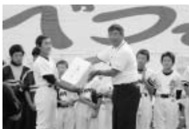
▼各賞の授与式の模様