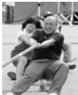
▲惜しくも準優勝の商工会青年部