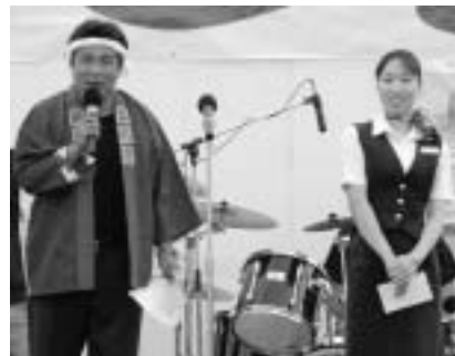
▲HACキャンペーン お得な航空運賃の紹介