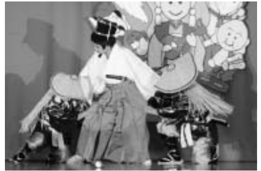
▶松江エンジェルによる踊り