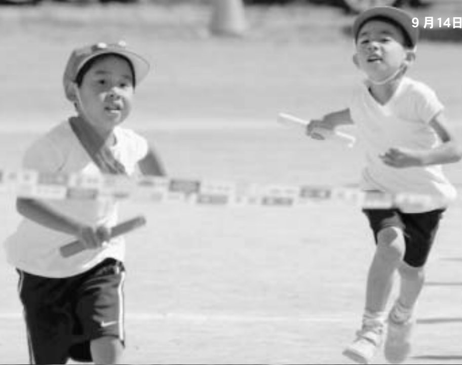
9月14日の奥尻幼稚園運動会の様子