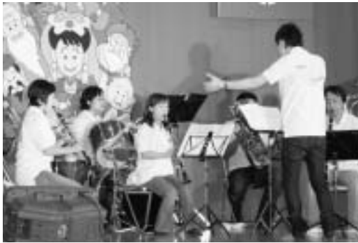
◀奥尻吹奏楽団の演奏