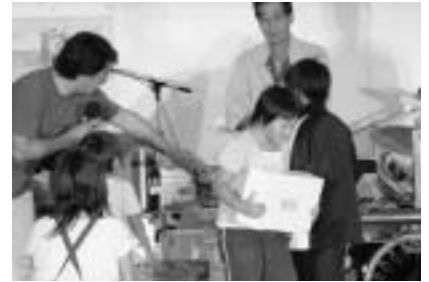
▲1人1枚のカードを手にも子どもも一緒に楽しんでいました。 大人は「ガソリン券」、子どもは「ニンテンドー・ウィー」が目玉賞品でした。