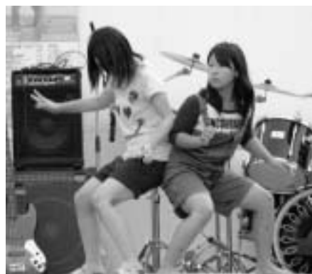
▶準備はいいかなー