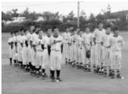
▲開会式、試合前の両チーム