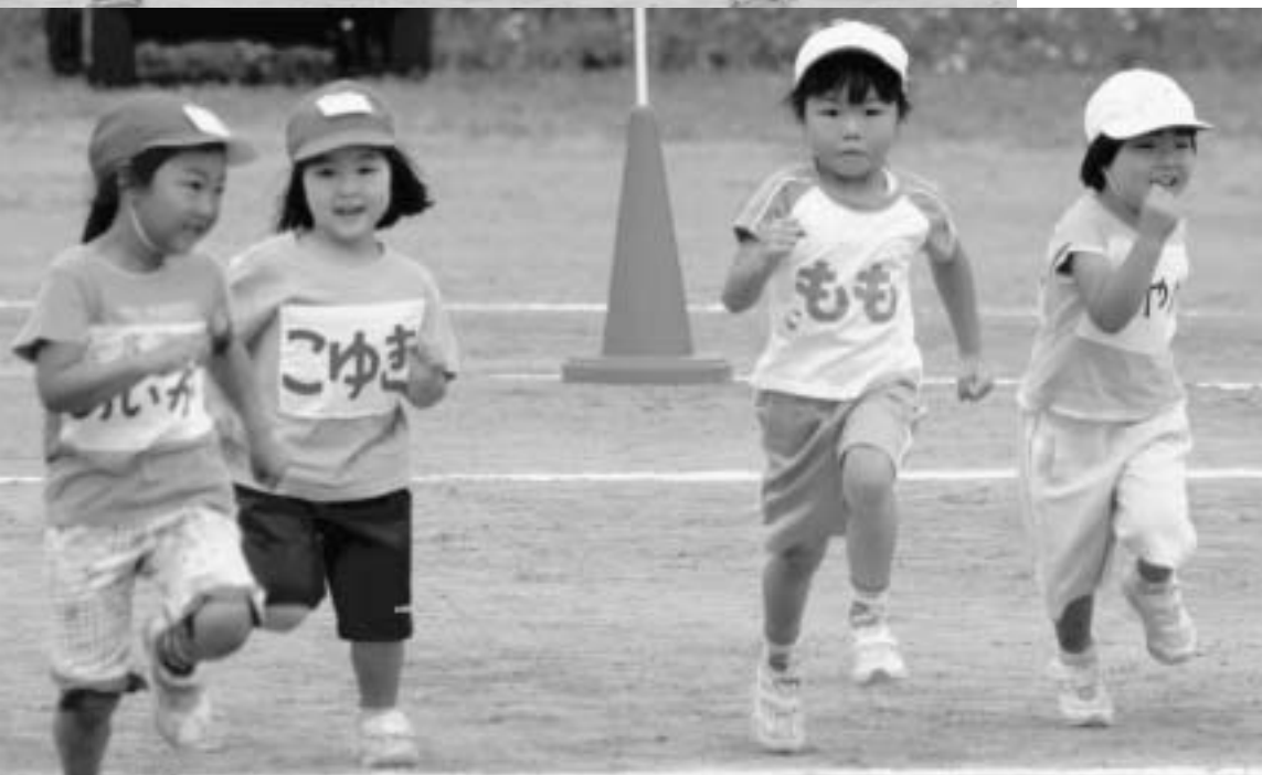
9月21日の東風泊保育所運動会の様子

走れ！走れ！がんばって〜！ 9月14日奥尻幼稚園運動会、21日東風泊保育所運動会・青苗幼稚園運動会がそれぞれ行われました。各運動会で、子どもたちの練習の成果や元気な姿にグラウンドに集まった親たちや観客から、声援と拍手が沸きあっていました。