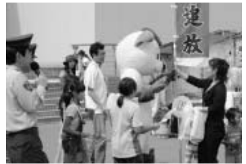
▲警察による暴力追放キャンペーン での「ほくとくん」