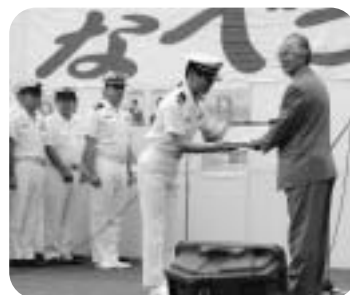
▲掃海艇の船長から、和町町長へ記念品が贈られました