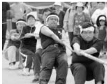
▲優勝してしまった？ 役場相撲部