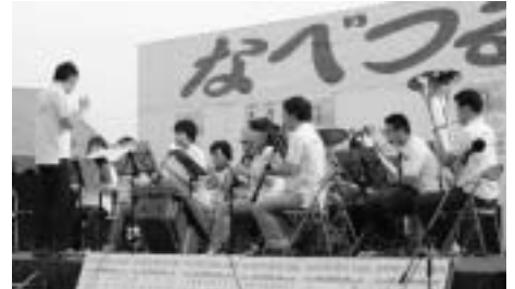
▲奥尻吹奏楽団 有志10名で演奏してくれました