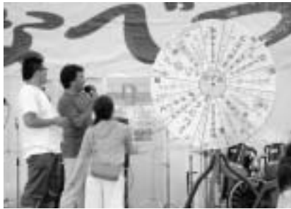
▲観光の方を対象に行われ、 賞品は、奥尻町の特産品