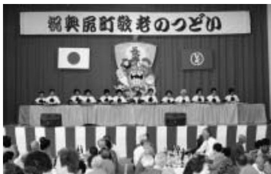
▶奥尻大正琴愛好会による大正琴の演奏