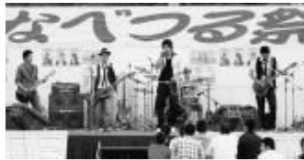
▲ブラックエンジェルス 奥尻高校生によるバンド演奏