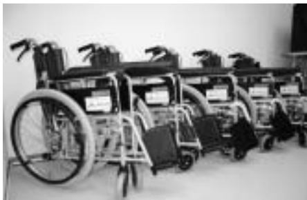
▶寄贈された車椅子5台

奥尻町社会福祉協議会では、福祉の充実のため、介護事業や高齢者、身障者の方々の支援活動等で幅広く活用することになっています。