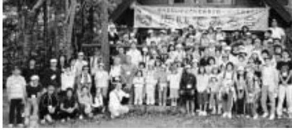
▲出発前に記念撮影

9月6日に約4kmの「らくちんコース」と約8kmの「さわやかコース」の「歩いてみる会」が開催され、総勢112名が参加し、あいにくの天候の中でしたが、復興の森から幌内地区までを、自分のペースで歩き、心地よい汗を流していました。