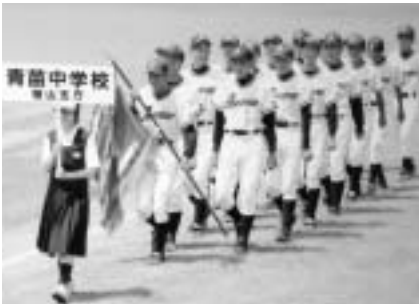
▲青苗中学校野球部