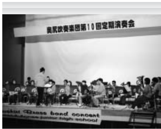
▲最後は全員でのステージでした。

除雪後などの路面は滑りやすく危険です 歩行者も車を運転される方も十分気を付けましょう