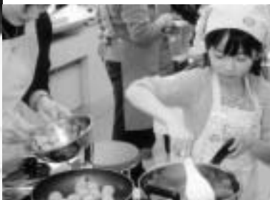
▲わくわく料理教室