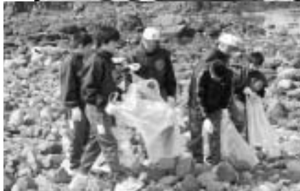
◀クリーンアップ作戦