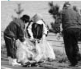
▲道路沿いの清掃 (各町内会)

4月18日に『奥尻町クリーンアップ作戦』が、全町一斉に展開され、早朝から各町内会や各事業所など約800名のボランティアによって、約11.4トンもの空き缶やゴミが回収されました。