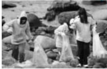
▼賽の河原の海岸を清掃 (奥尻中学校)