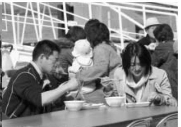
▲みんな美味しいと評判でした