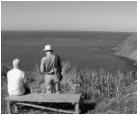
▶奥尻島フットパス(米岡地区)

を養殖生簀で自分が実際にあわびを採る「鮑狩り体験」を奥尻島観光協会が窓口となり進めて行きます。