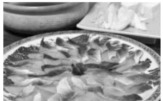
▲「ほっけのはんじゅく」