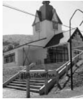
▶「稲穂ふれあい研修センター」

■「稲穂ふれあい研修センター」 奥尻島の遺跡から発掘された土器・石器、近現代の古民具などを展示しています。