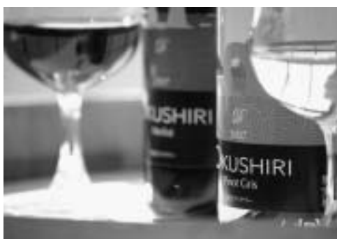
▼今年4月に販売が開始された「奥尻ワイン」