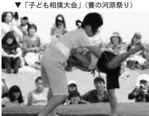
▼「子ども相撲大会」(賽の河原祭り)