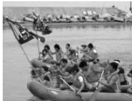
▲「ボート漕ぎ競争」(室津祭り)