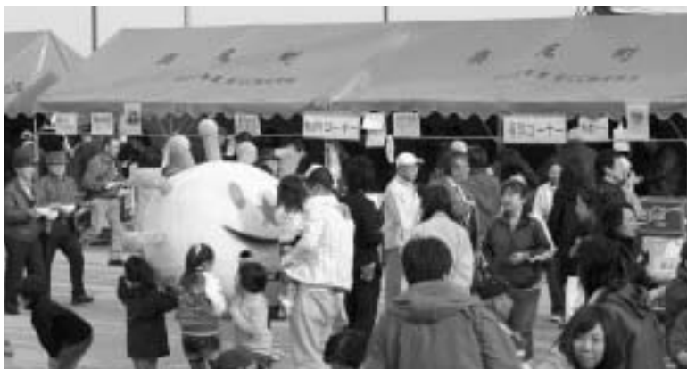
▲ウニまるちゃんも大忙し

観光シーズンが始まりました。たくさんの方が、「奥尻島」を訪れ、「また遊びに来てみたい」、「また美味しいものが食べたい」と思ってくれるような「島」になるよう願って、「奥尻しまびらき」が、5月1日に奥尻港湾特設会場で行われました。 会場では、島外から訪れた、たくさんのお客様の皆さんやまちの人たちが、「振る舞い三平汁」や「島びらき屋台」での海の幸などを堪能する光景が見られました。