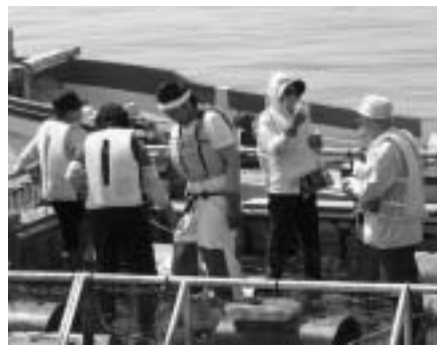
▲ 鮑 狩 り 体 験

観光客は海の上で食べる「あわび」の味に感激、その場でお土産としてお買い求めができる便利さもあり、満足度が高い体験メニューとして定着しつつあります。