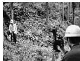
間伐のための境界特定