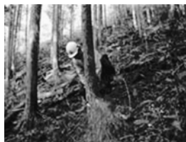
間伐の実施や林道までの搬出