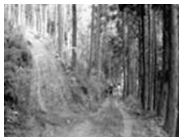
作業道・作業路の作設