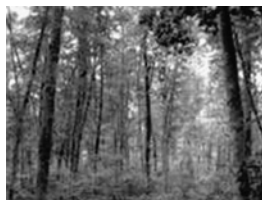
広葉樹の植栽、かき起こし