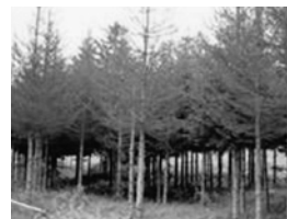
ヤツバキクイムシの防除等

※森林組合・林業事業体に対し、里山の再生のため新たに北海道が設定する単価より一定額を助成します。