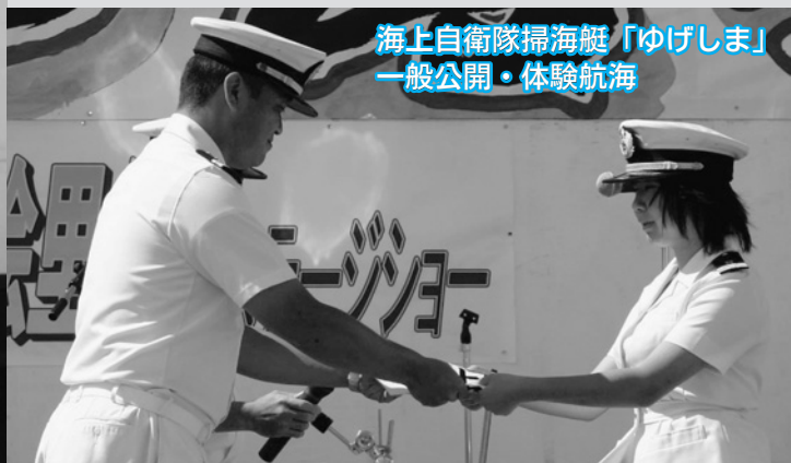
海上自衛隊掃海艇「ゆげしま」 一般公開・体験航海