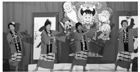
▶ たちはな会による舞踊