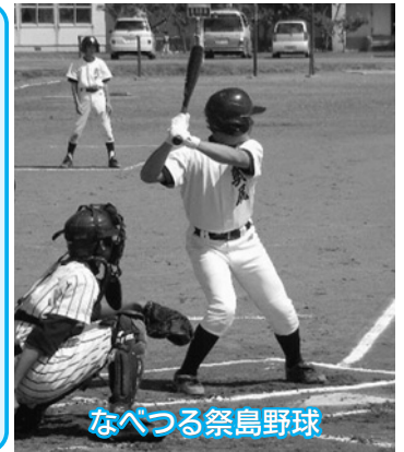
なべつる祭島野球