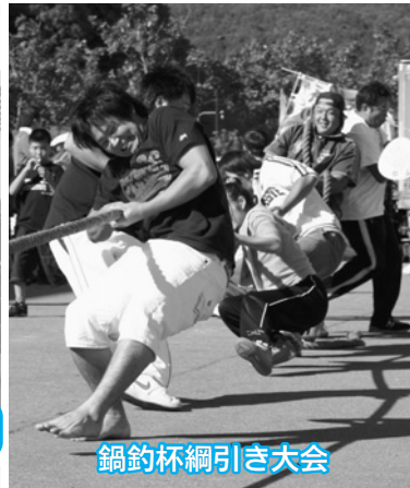
鍋釣杯綱引き大会

鍋釣杯綱引き大会 ◇優勝 WILDBEAST ◇準優勝 さんぱち会 ◇3位 北日本海工 チーム三浦