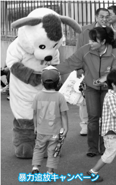
暴力追放キャンペーン

鍋釣杯綱引き大会 ◇優勝 WILDBEAST ◇準優勝 さんぱち会 ◇3位 北日本海工 チーム三浦