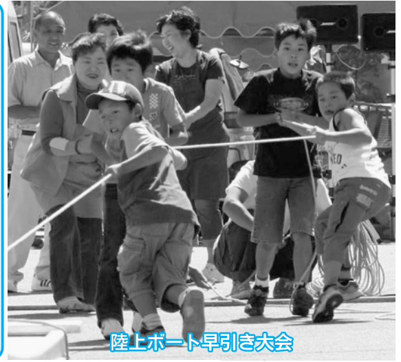
陸上ボート早引き大会