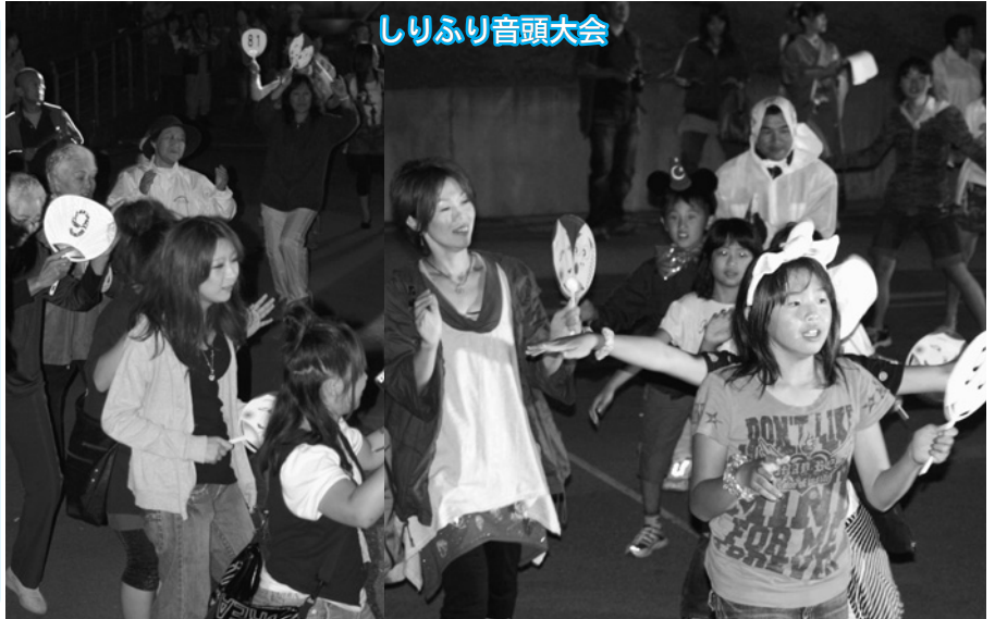
しりふり音頭大会