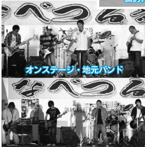
オンステージ・地元バンド