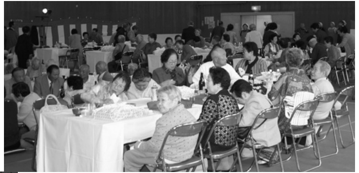
▲皆さん楽しく過ごされていました