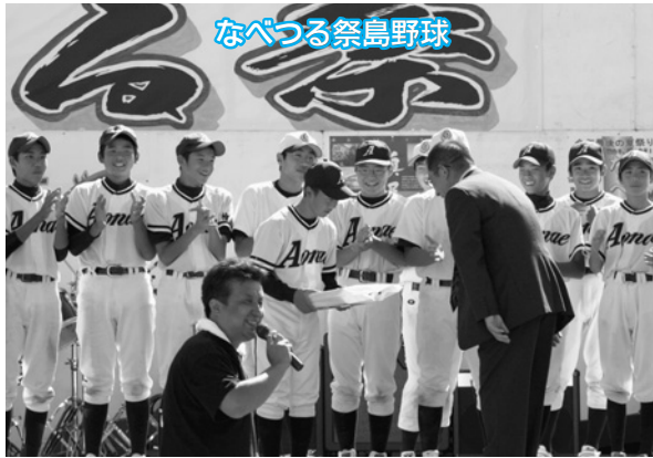
なべつる祭島野球