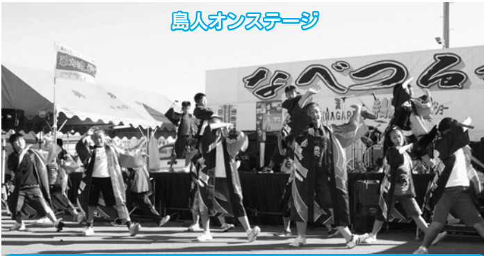
鳥人オンステージ