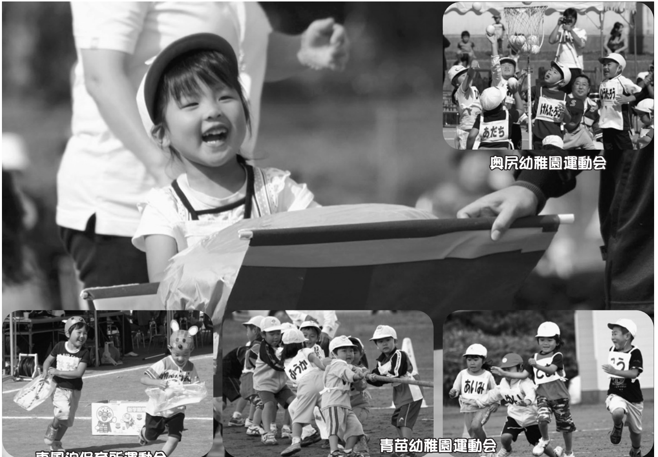
奥尻幼稚園運動会