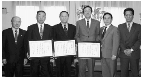
▲3名の方が出席されました