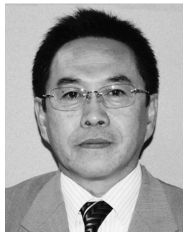
奥尻町長 新村 卓 実