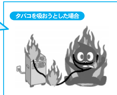
【出典】PMDA医療安全情報No.4