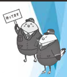
江差警察署防犯キャラクター かもめのかも太郎