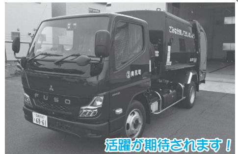
活躍が期待されます!

令和3年12月に更新したバキューム車と同様に今までの「緑色」から「紺色」がベースの車両に変更となりますのでゴミ収集(ゴミ出し)の際は、お間違えの無いようご注意ください。