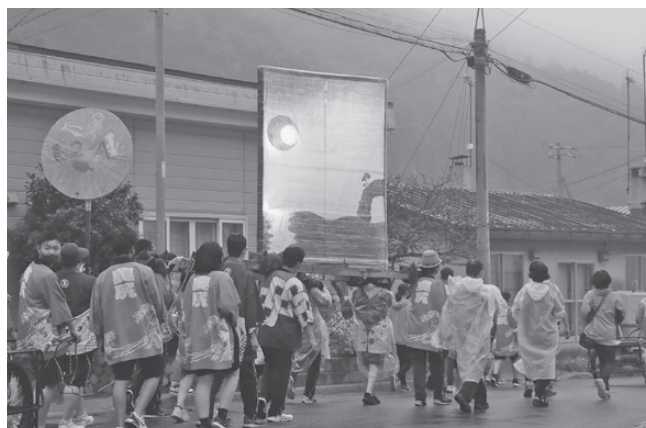
7月奥尻高等学校文化祭行燈行列