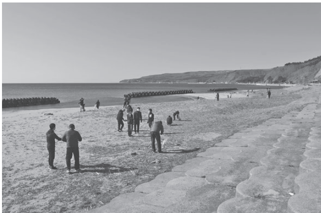
4月 クリーンアップ作戦・海浜清掃