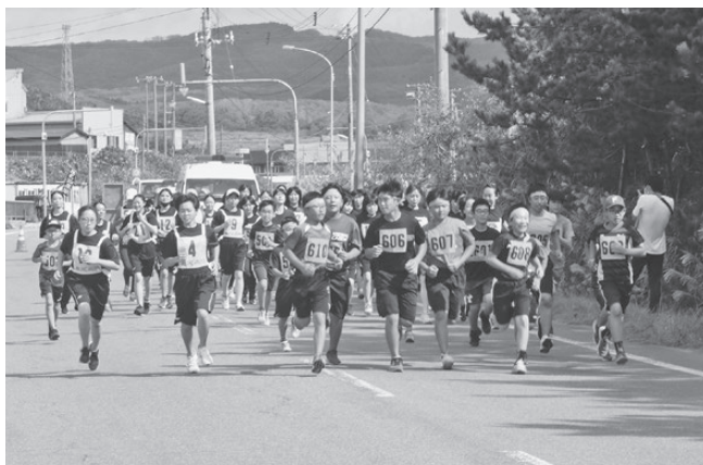
10月第30回町民体育祭マラソン大会