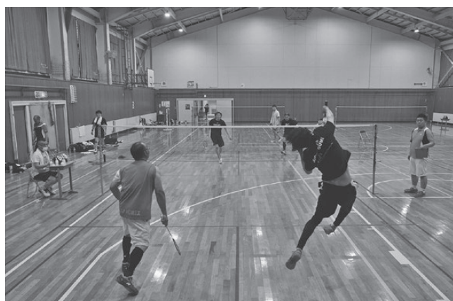
7月ひやま管内スポーツフェスタ バドミントン競技の部