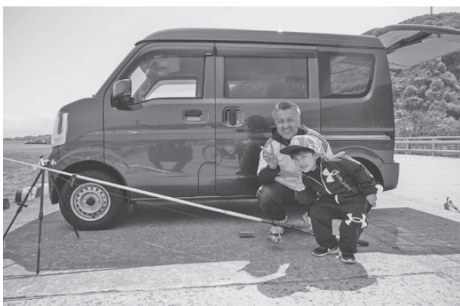
5月 ファミリーフィッシング大会