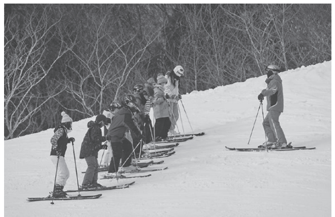
1月 町民スキー教室