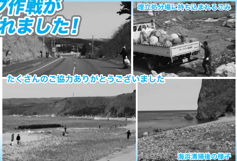
たくさんのご協力ありがとうございました

各町内会をはじめ、事業所・団体など多くの方々にも今年もご参加いただきました。これからもごみの散乱がない「きれいな奥尻島」を目指し、ご協力をお願いします。