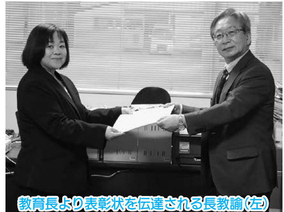
教育長より表彰状を伝達される長教諭(左)