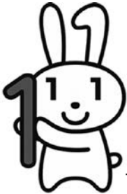
マイナンバーPRキャラクター「マイナちゃん」

マイナンバーカードは、各種手続きやサービスをご利用される際に、ご自身のマイナンバーや確実な本人確認ができる公的証明書として機能するほか、今後は、健康保険証としての利用やスマホ決済などのキャッシュレスでお買い物をした場合などにポイントが付与される制度など、マイナンバーカードと連携したサービスの実施が予定されています。