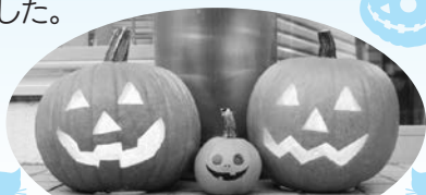
店舗入口でのお出迎え(^^)♪

同支店では、このカボチャから取り出した種を今後、蒔いて「来年はもっと仲間を増やしたい!」と、期待を込めていました。