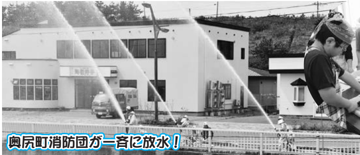
奥尻町消防団が一斉に放水!