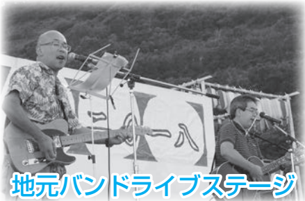
地元バンドライブステージ