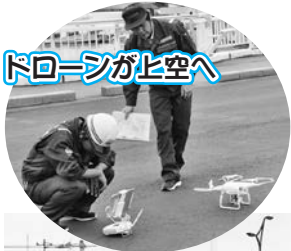
ドローンが上空へ