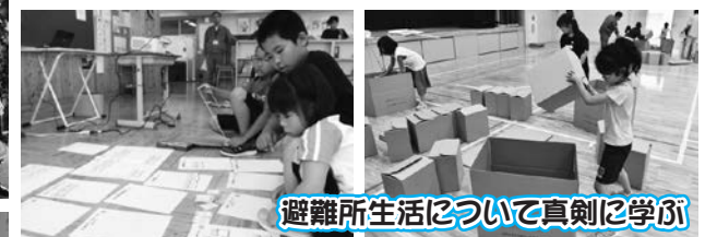
避難所生活について真剣に学ぶ