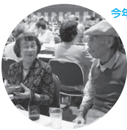
今年も「余興」は大盛況!