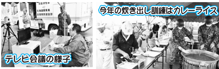
テレビ会議の様子