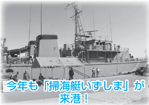
今年も「掃海艇いずしま」が来港!