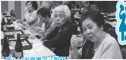
楽しいお食事で「乾杯」