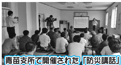
青苗支所で開催された「防災講話」