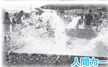
人間カーリング大会