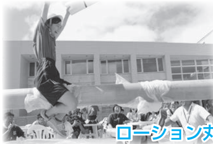
ローション丸太落とし大会