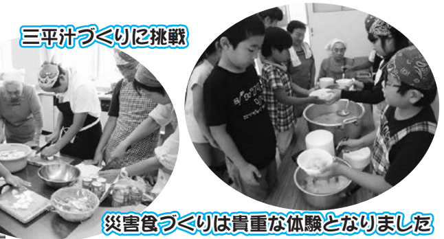
災害食づくりは貴重な体験となりました