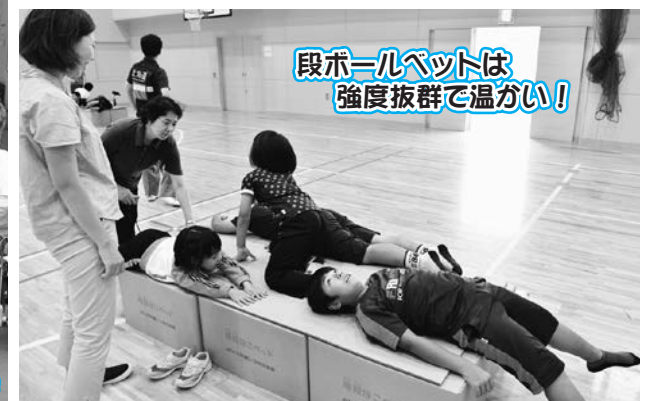
段ボールベットは強度抜群で温かい!