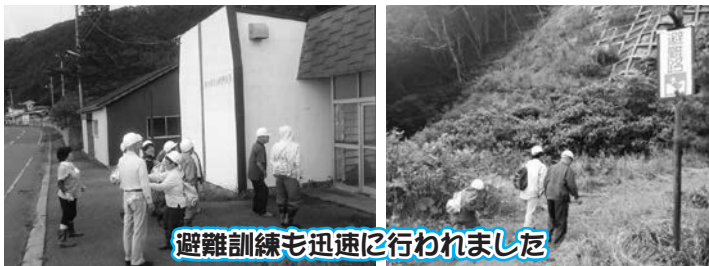
避難訓練も迅速に行われました