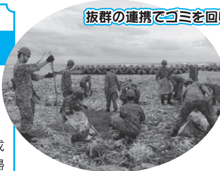
抜群の連携でゴミを回収