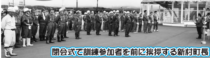
閉会式で訓練参加者を前に挨拶する新村町長