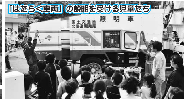
「はたらく車両」の説明を受ける児童たち