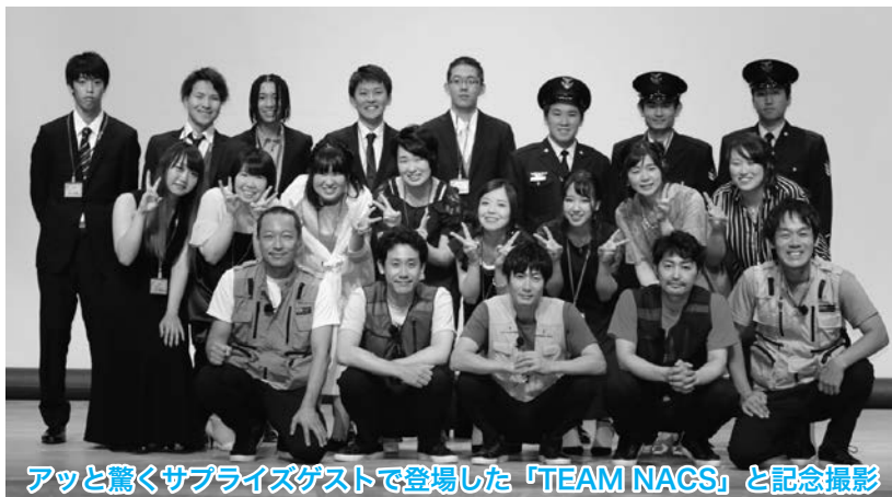
アッと驚くサプライズゲストで登場した「TEAM NACS」と記念撮影