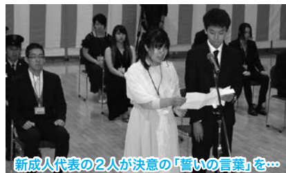
新成人代表の2人が決意の「誓いの言葉」を…