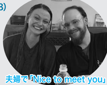
夫婦で「Nice to meet you」