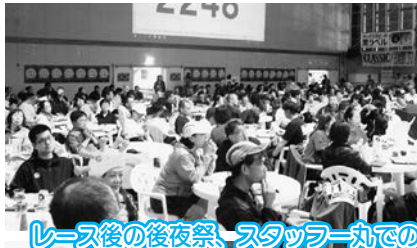
レース後の後夜祭、スタッフ丸での「島の食振る舞い」も大盛況!