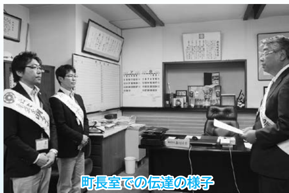
町長室での伝達の様子