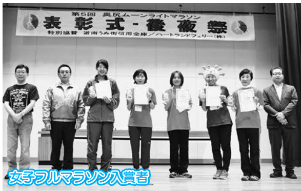
女子フルマラソン入賞者