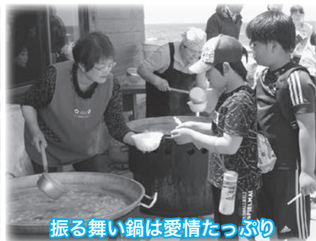
振る舞い鍋は愛情たっぷり