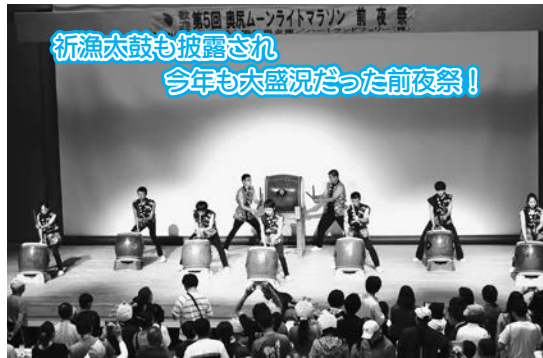
行漁太鼓も披露され 今年も大盛況だった前夜祭!