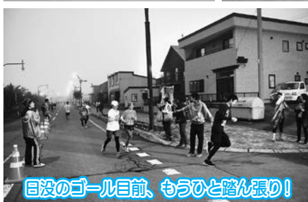
目没のゴール目前、もうひと踏ん張り!