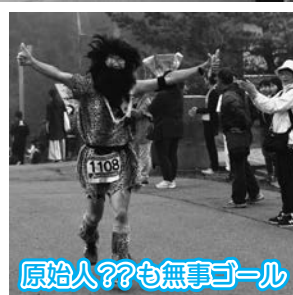
原始人??も無事ゴール