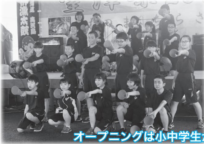
オープニングは小中学生が盛り上げてくれました！