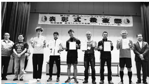
男子フルマラソン入賞者