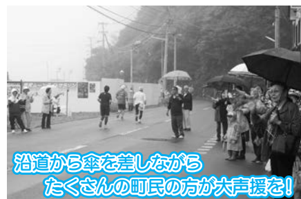
沿道から傘を差しながら たくさんの町民の方が大声援を!