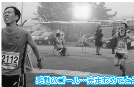
感動のゴール...完走おめでとございます!