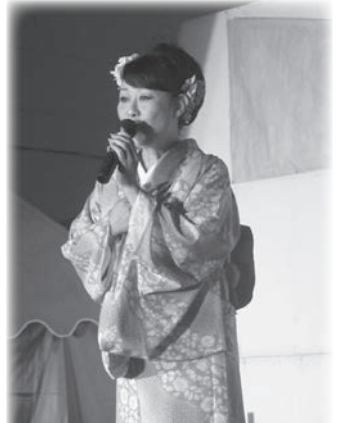
ステージから響く音色に会場也大盛り上がり