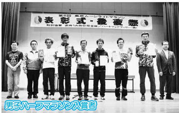
男子ハーフマラソン入賞者

次回の ●第6回奥尻ムーンライトマラソン● 注目の開催日時は... 《平成31年6月15日(土)》に決定!!