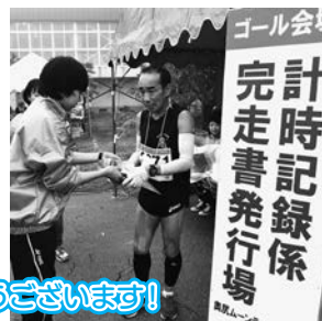
ゴール会場 計時記録係 完走書発行係