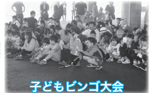
子どもビンゴ大会