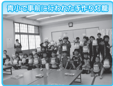
青小で事前に行われた手作りの灯籠