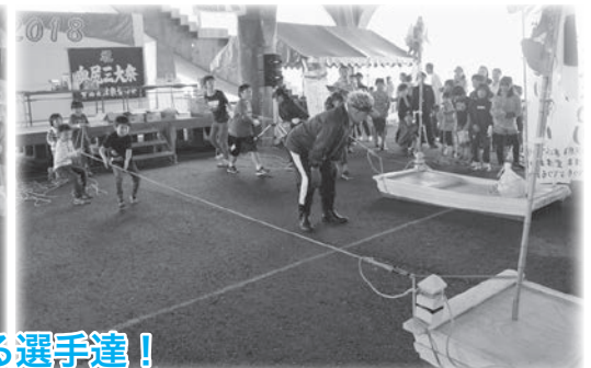
声援を受けて走る、引っ張る選手達！