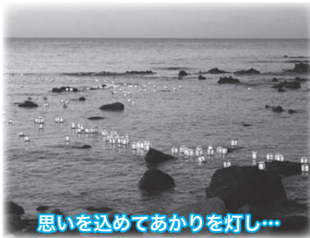
思いを込めてあかりを灯し...