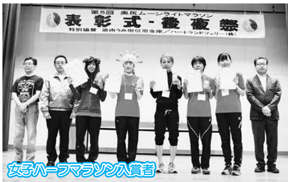
女子ハーフマラソン入賞者

次回の ●第6回奥尻ムーンライトマラソン● 注目の開催日時は... 《平成31年6月15日(土)》に決定!!