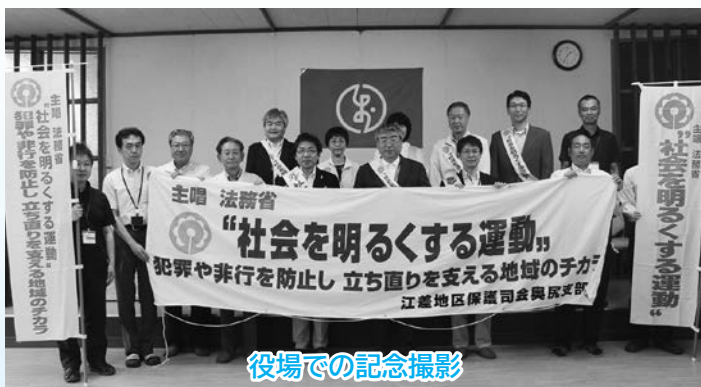
役場での記念撮影

「社会を明るくする運動」は、すべての国民が犯罪や非行の防止に努め、あやまちを犯した人の更正について理解を深め安全で安心な地域社会を築こうとする全国運動、そして「青少年の非行・被害防止道民総ぐるみ運動」は、北海道の未来を担う青少年が社会の一員として豊かな人間性や社会性を身につけ、たくましく育っていくための非行と被害防止を図る道民運動です。