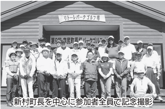
新村町長を中心に参加者全員で記念撮影