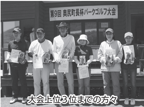
大会上位3位までの方々

今年で第9回を迎えた「奥尻町長杯パークゴルフ大会」が5月27日リトーレパークゴルフ場において開催されました。晴天の下、起伏に富んだコースの中を出場された32名の方々は、18ホール2ラウンド制で熱戦を繰り広げました。今年もホールインワンを2名が達成するなど、大変盛り上がった見どころのある大会となりました。大会の結果は次のとおりです。