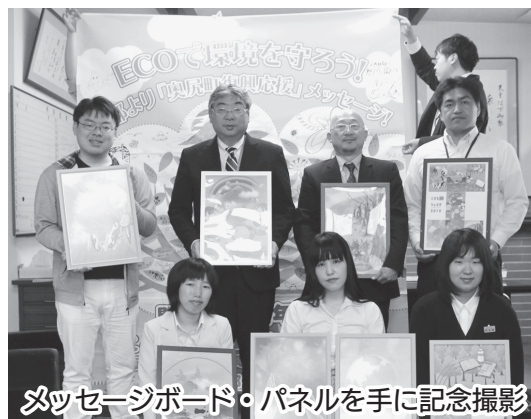
メッセージボード・パネルを手に記念撮影

北海道南西沖地震から25年を迎える本年、京都市において震災をテーマとしたイベントを開催しパネル等を展示「北海道南西沖地震の風化を防ごう」という思いを込めた来島でした。大変ありがとうございました。