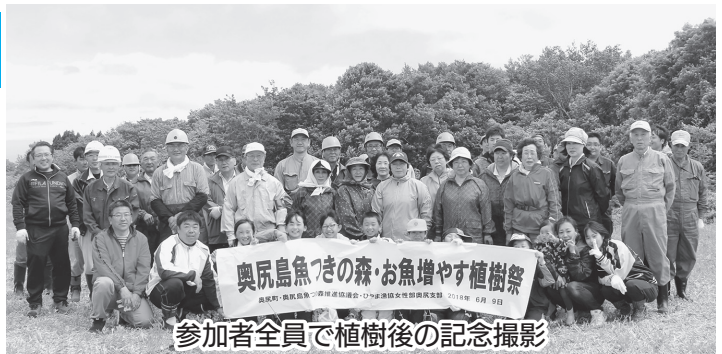
参加者全員で植樹後の記念撮影

6月9日、奥尻島豊かな森において「北の魚つきの森植樹活動」が漁協女性部の「お魚殖やす植樹活動」と合同で開催されました。参加された約80名の方々は、それぞれ未来奥尻島の「緑がいっぱい」への思いを込めて、合計300本のミズナラを植樹されました。