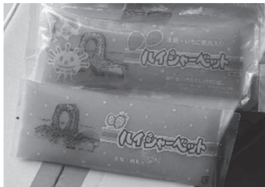
坪谷冷菓店の看板商品ハイシャーベットには町のシンボルなべつる岩やご当地キャラのうにまるがデザインされています。