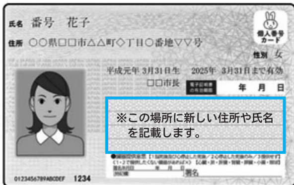
マイナンバーカードの場合（表面）