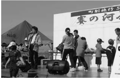
6月 賽の河原まつり