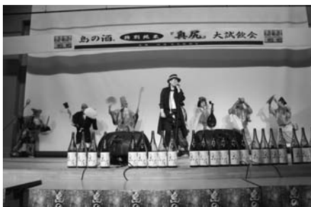
5月 日本酒大試飲会