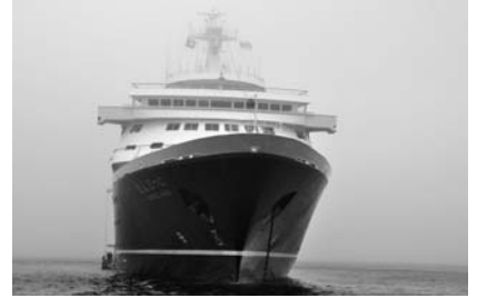
7月 にっぽん丸寄港