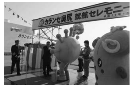
5月 カランセ奥尻就航記念セレモニー