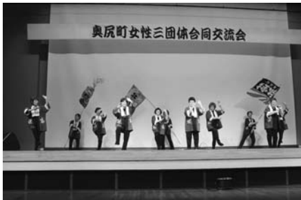
1月 第35回女性三団体交流集会