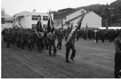
6月 消防総合訓練大会