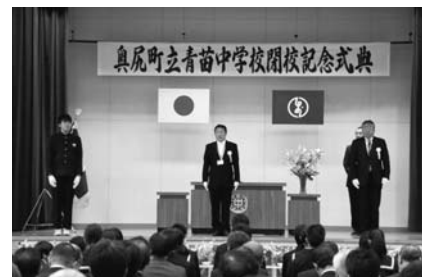
2月 青苗中学校閉校記念式典

西暦2017年(平成29年)も幕を閉じ、新たな年を迎えました。皆様にとって、昨年はどういう年だったのでしょうか。今年は昨年以上に良い年になると良いですね。 ここでは、昨年の町内の行事・出来事を広報紙からピックアップして振り返ってみたいと思います。