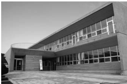
4月 奥尻中学校開校式