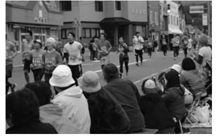
6月 ムーンライトマラソン