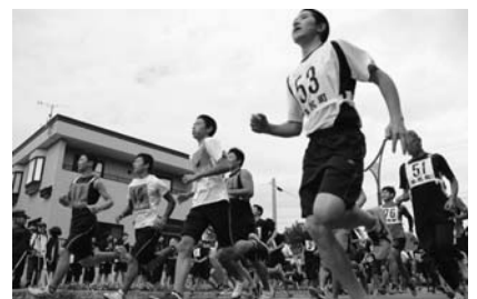
10月 町内マラソン大会