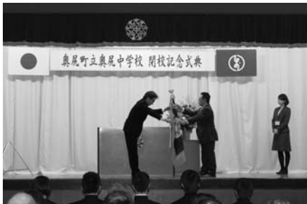
2月 奥尻中学校閉校記念式典