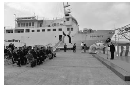
4月 アヴローラ奥尻さよならセレモニー