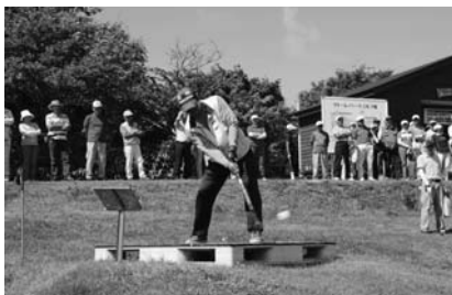
9月 スポーツフェスタパークゴルフの部