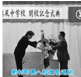
新村町長へ校旗を返納