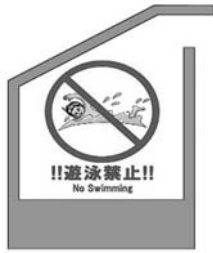
※遊泳等禁止区域のイメージ