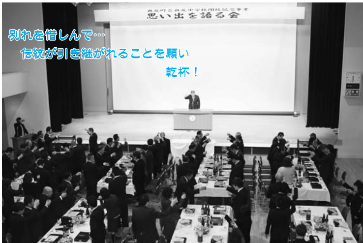
別れを惜しんで… 伝統が引き継がれることを願い 乾杯!