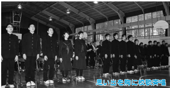
思い出を胸に校歌斉唱