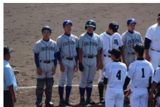
←試合終了 全員、一生懸命に頑 張りました。