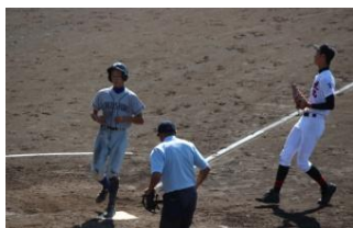
←白田君、 ホームイン！！