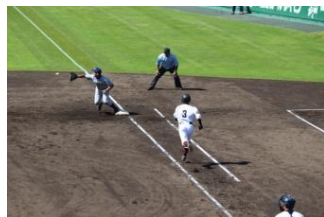
→ 一塁 満島君 ナイスキャッチ！