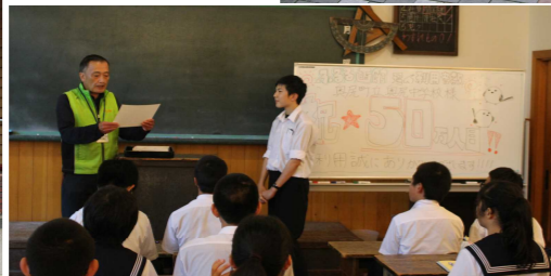
ふるる函館所長さんから記念状贈呈