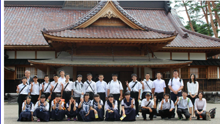
五稜郭の旧函館奉行所にて

なお、宿泊した函館市青少年研修センター(ふるる函館)では、奥尻中学校2年生が開校後50万人目の利用ということで記念状などを贈呈され、入所式がちょっとしたサプライズイベントとなりました。