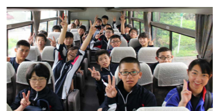
バスの中も楽しく過ごす