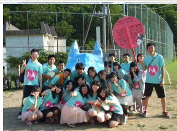
1年生となりのトトロ（第2位）