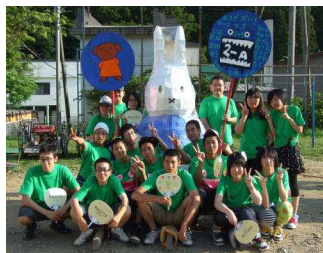
2年生ミッフィー（第3位）