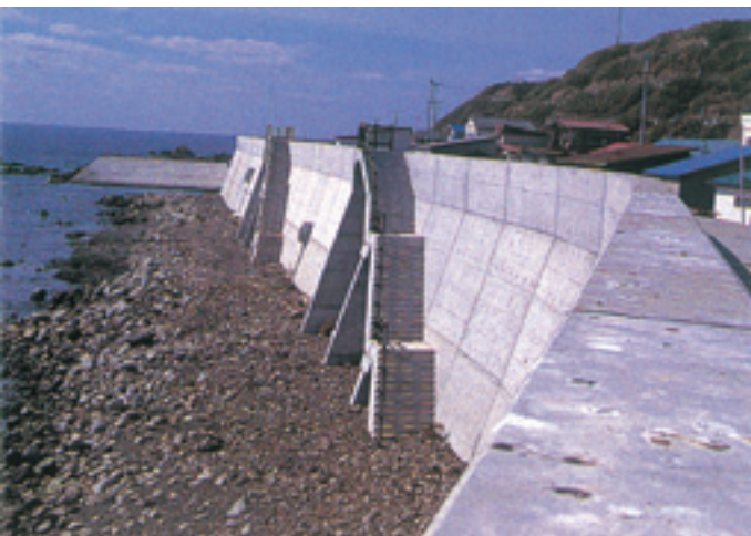
▲復旧、復興、今後の防災対策として防潮堤が整備された