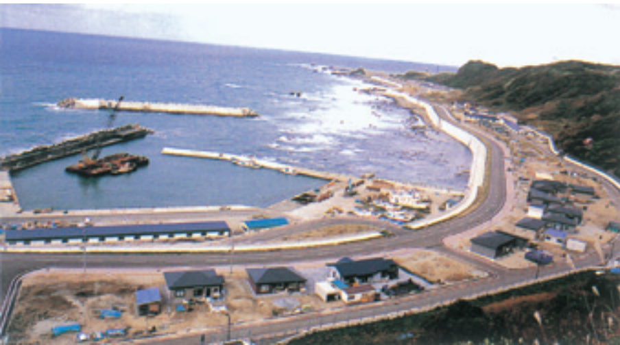
▲新しく生まれ変わった稲穂地区

稲穂地区では、水産庁の補助事業である「漁業集落環境整備事業」として、防潮堤の背後地を盛土(5m)して宅地整備を進めました。