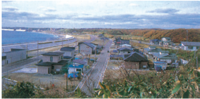
▼壊滅した町並が蘇った初松前地区