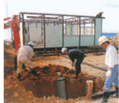
▲一時的に設置された仮設住宅

住家を失い、被災を受けた住民は、直ちに地域防災計画で指定されている学校や集会所などへ下表のとおり避難しました。