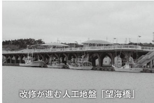
改修が進む人工地盤「望海橋」

に解除の予定であります。 なお、津波等の避難が必要な場合は使用可能である旨、漁業者等にも伝えられています。