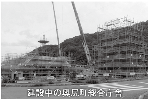
建設中の奥尻町総合庁舎

昨年度の観光客の入込数は2万5138人。津波館入館者は2186人であり、観光産業はフェリー航路、航空路線の維持と島の経済発展には重要な産業の一つと認識しています。