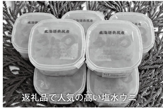
返礼品で人気の高い塩水うどん

返礼品製造者に対する商品開発等への予算確保については、現在のところ町として確保する意向はありません。