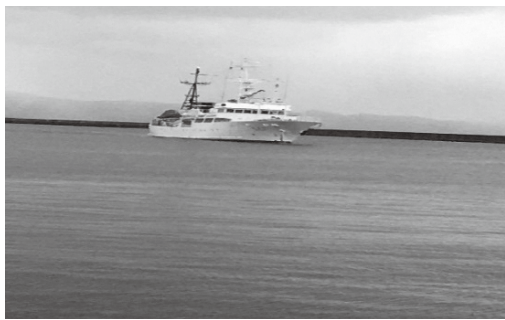
感染者を搬送するため奥尻港へ入港

今回のように、島内にPCR検査機器があればもう少し迅速な対応ができたのではと考えるところですが、PCR検査機器があったとしても国保病院の現体制では不可能なことでありますので、今後も関係機関の指導のもと、連携を取りながら対応していきたいと思えます。