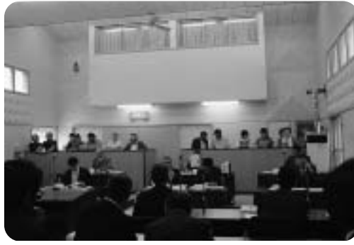
【商工会女性部の傍聴】

平成19年第3回定例町議会は、9月13、14日に招集され、平成19年度一般会計補正予算及び各特別会計補正予算、奥尻町基金条例等を審議し、いずれも可決され、14日に閉会しました。なお、平成18年度各会計