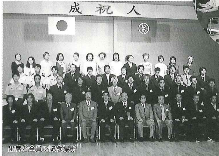
出席者全員で記念撮影