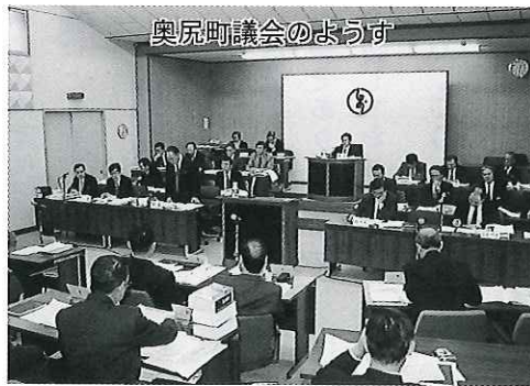
奥尻町議会のようす

間近に迫った介護保険制度の導入をはじめ、総合的な福祉対策の推進、下水道など身近な社会資本整備の充実、過疎問題への対応等に向けた施策の展開、さらに地方分権の推進は必然的に地域の総合的行政主体である地方公共団体の自己決定権と自己責任の拡大を伴うものであり、我々自