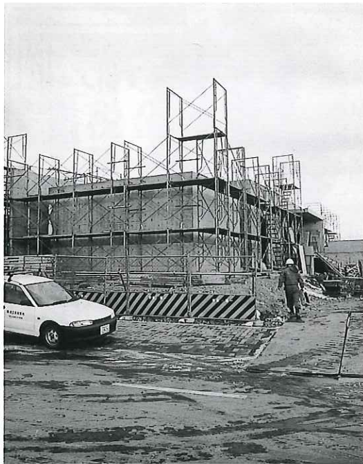
▲今年10月完成予定の「奥尻島津波館」