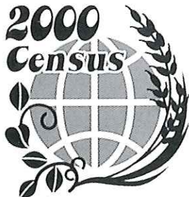
2000年 世界農林業センサス

この調査は、我が国の農林行政に係る諸施策及び農林業に関して行う諸統計調査に必要な基礎資料を整備し、各国農林業との比較において我が国農林業を明らかにすることを目的として実施されます。本年2月1日現在で調査員さんが伺いますのでご協力をお願いします。