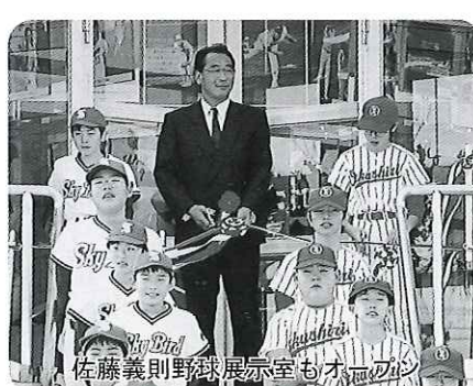
佐藤義則野球展示室もオープン