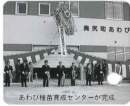
あわび種苗育成センターが完成