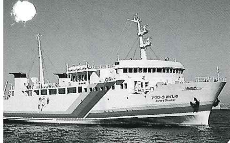
4月から就航した「アプローチおくしり」