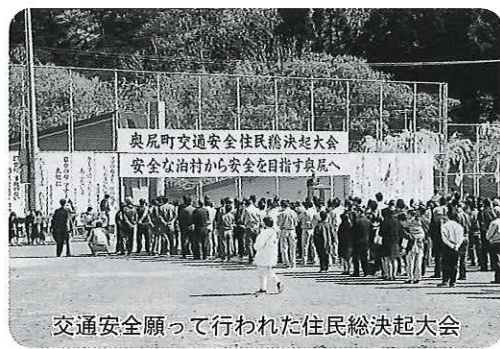
交通安全願って行われた住民総決起大会