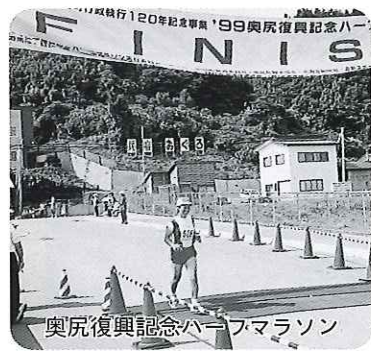
奥尻復興記念ハーフマラソン