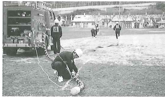
緊張感のある見事な訓練でした

着後、来賓等がその勇ましい姿を観閲、そして神崎団長より激励のあいさつが述べられました。