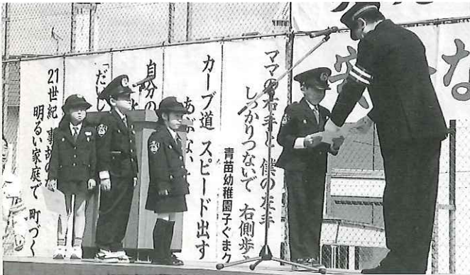
〈泊村と奥尻町のチビッコ一日警察官〉