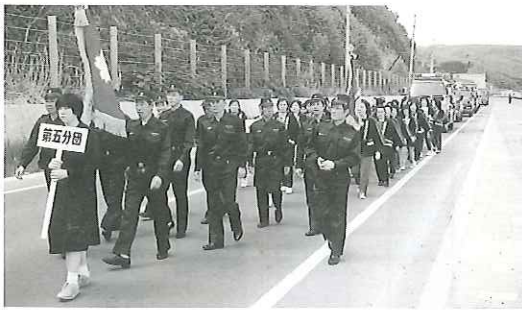
勇ましいパレード行進