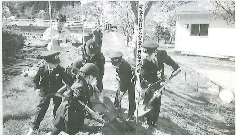
〈安全を願って泊村から寄贈されたサクラを植樹〉