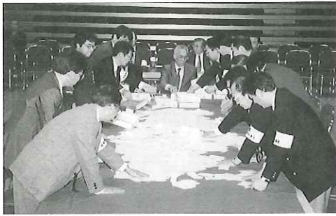
海洋研修センターでの開票の様子

4月11日、北海道知事・北海道議会議員選挙が行われ、奥尻町における投票はそれぞれ即日開票され、次表のような結果となりました。