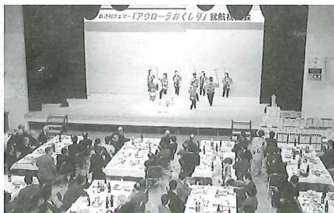
江差餅つきばやしに大きな拍手

ちなんでの鏡割を7名の代表者が「よいしょ!」のかけ声で豪快に割り、盛大な拍手が響く中祝杯をあげ、祝宴の余興では商工会婦人部の方々の歌や踊り、そしてこの日のためにかけつけてくれた特別ゲストの芸能生活45年の大ベテ