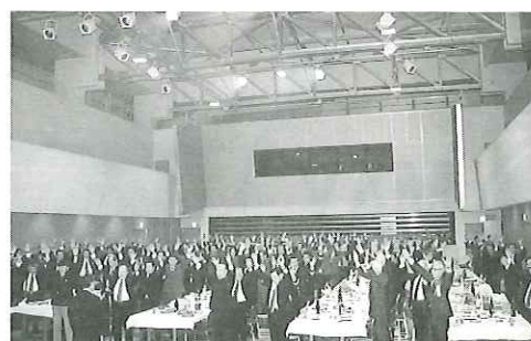
出席者全員での万歳三唱