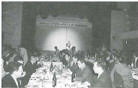
余興でも盛り上がった会場内