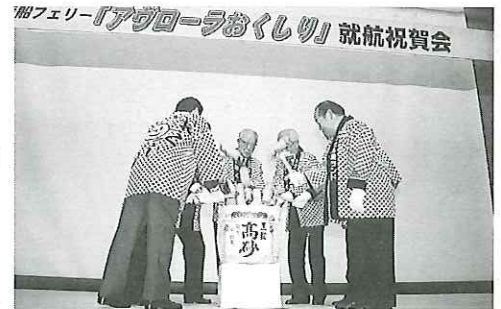
代表者による鏡割

ちなんでの鏡割を7名の代表者が「よいしょ!」のかけ声で豪快に割り、盛大な拍手が響く中祝杯をあげ、祝宴の余興では商工会婦人部の方々の歌や踊り、そしてこの日のためにかけつけてくれた特別ゲストの芸能生活45年の大ベテ