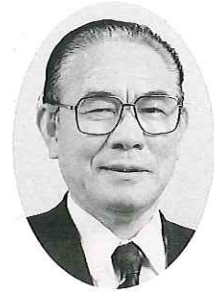
奥尻町長 越森 幸夫