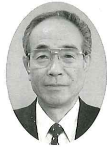
奥尻町教育委員会委員長